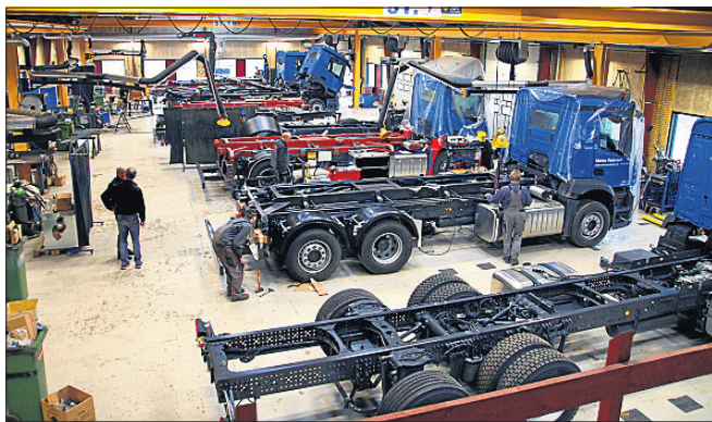
SAWO har skabt 50 industrijobs, siden hejseledsproduktionen blev flyttet tilbage til Danmark.