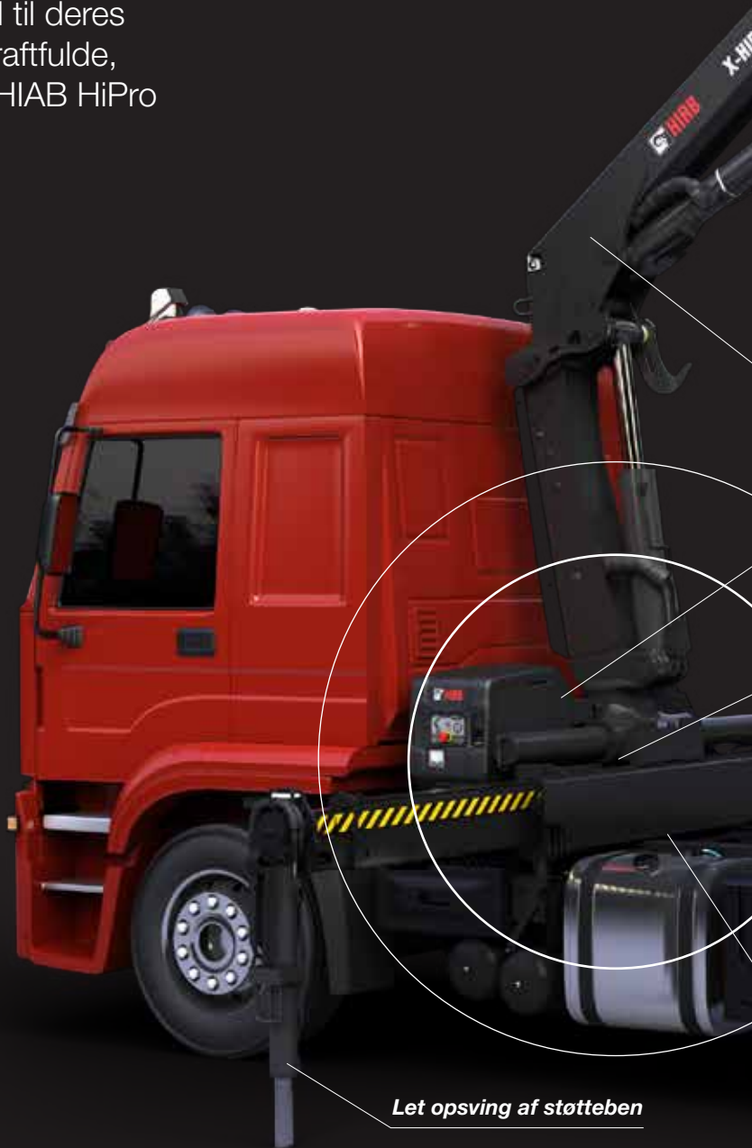
Let opsving af støtteben

LSS dæmper automatisk de hårde stop, der ellers kan få lasten til at svinge. Det gør kranstyringen hurtigere og mere jævn, og det hjælper også med at beskytte lasten, køretøjet og omgivelserne omkring kranen mod mulige skader.