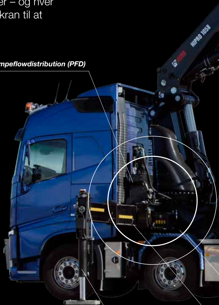
Let vipning af støtteben